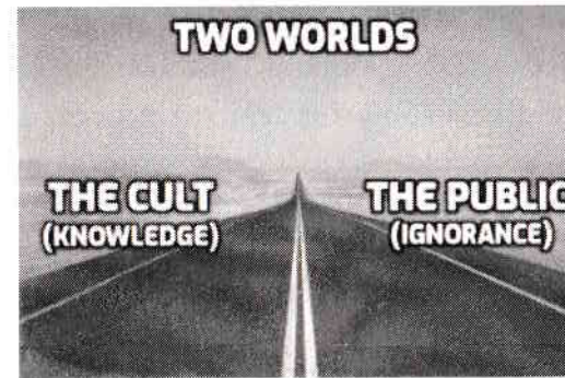
Figura 6: Cele două lumi despărțite prin accesul la cunoaștere. Pânza societăților secrete transmite informații pe baza principiului „nevoii de a ști”, prin nivelurile de „grade”, referitoare la planul pentru omenire și la adevărata natură a realității. Populației îi este suprimată cunoașterea prin sistemul de „educație” creat de Cult și prin mass-media deținută de acesta.

mulți. Dacă adăugăm entitățile demonice invizibile pentru ochiul uman la acei câțiva membri ai societăților secrete care înțeleg pe deplin ce fac, ecuația devine ridicolă. Cei care controlează sunt copleșitor de puțini în comparație cu cei controlați. Acei câțiva demoni trebuie să controleze percepția populației pentru a-și impune dominația. O fac prin deturnarea conștiinței individuale și colective a celor vizați.