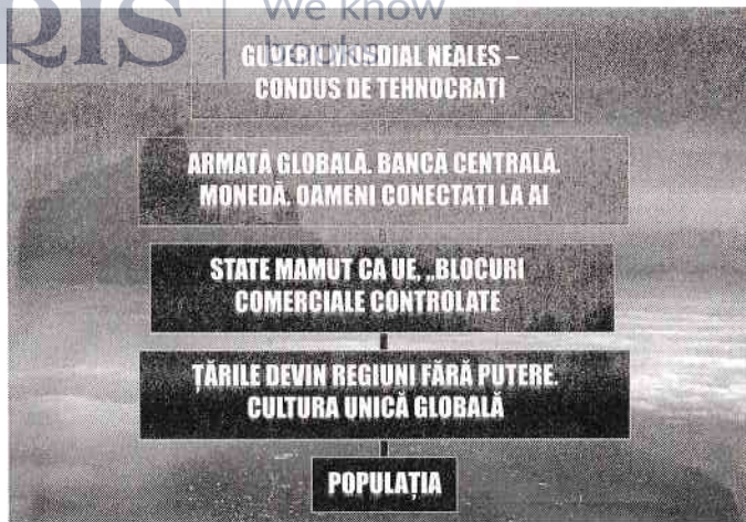
Figura 4: Aici se îndreaptă planul – către o dictatură tehnocratică globală, nealeasă, despre care am avertizat în toți acești ani și care este construită în jurul nostru, zi de zi. (Imagine de Gareth Icke.)

se îmbină piesele – și nici măcar toți dintre ei nu cunosc întregul adevăr. Aceste compartimentări ale societăților secrete sunt cunoscute sub numele de „grade”. Cele mai elitiste societăți secrete sunt atât de bine ascunse încât aproape niciunul dintre membrii lor nu are idee despre adevăratul motiv al existenței lor. Doar nucleul interior, cercul central, cunoaște acest lucru. Această structură ascunsă poate fi simbolizată cu acuratețe printr-o pânză de păianjen formată din societăți secrete și grupuri semi-secrete, având un „păianjen” în centru care dirijează evenimentele și impune propria agendă pentru omenire (Fig. 3).