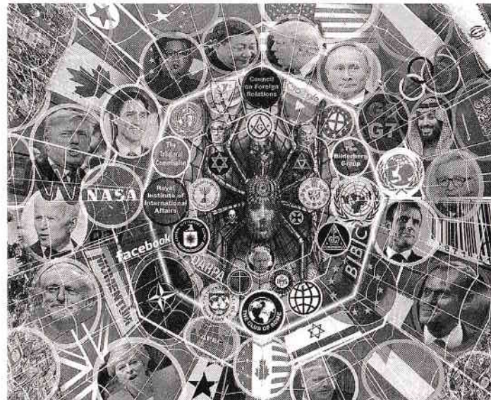
Figura 3: Structura Cultului Global. Agenda distopică este proiectată dinspre „păianjen” și se transmite prin pânza societăților secrete în lumea vizibilă, pentru a fi pusă în aplicare de guverne și corporații prin intermediul grupurilor secrete, organizațiilor neguvernamentale (ONG-uri) și al „laboratoarelor de idei” (think tank-uri).

Pânza este strict compartimentată, conform principiului „nevoii de a ști”. Doar nucleul interior și apropiații săi cunosc imaginea de ansamblu. Restul știu doar atât cât este necesar pentru a contribui la un rezultat despre care fie nu au nicio idee, fie îl înțeleg doar parțial. (Imagine de Neil Hague.)