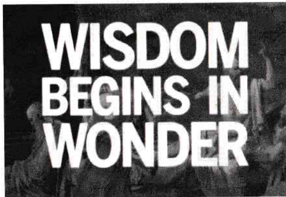
Figura 2: Fără minunare și curiozitate nu poate exista înțelepciune. Minunarea acceptă și celebrează incertitudinea.

Am dezvăluit încă din 1990 (find luat în răs și respins până de curând) faptul că omenirea este controlată de o forță demo-